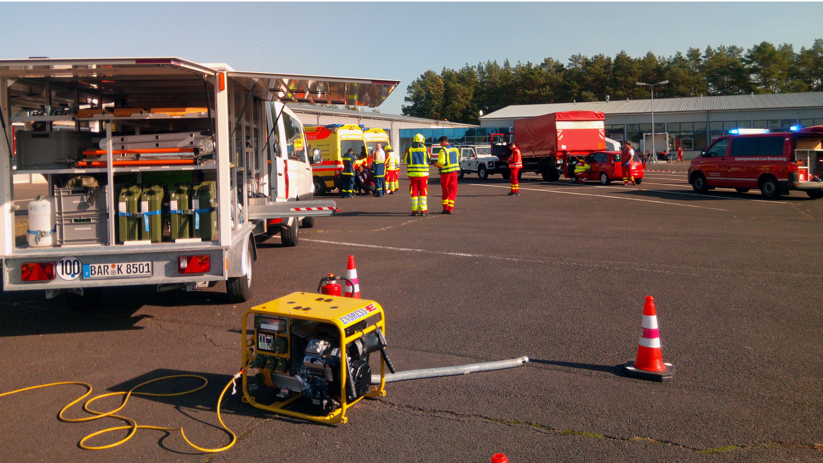
Gemeinsame Ausbildung der ehrenamtlichen Helfer im Barnim