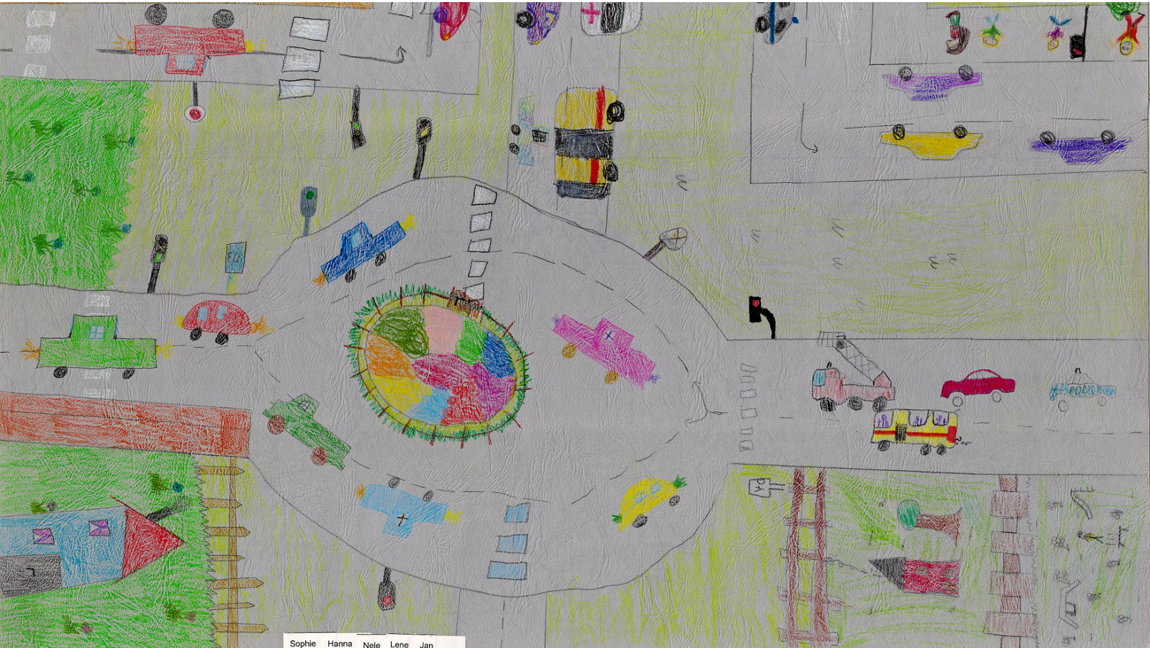
Gruppen-Gewinnerbild aus dem Hort Wandlitz: Repro: Pressestelle LK Barnim