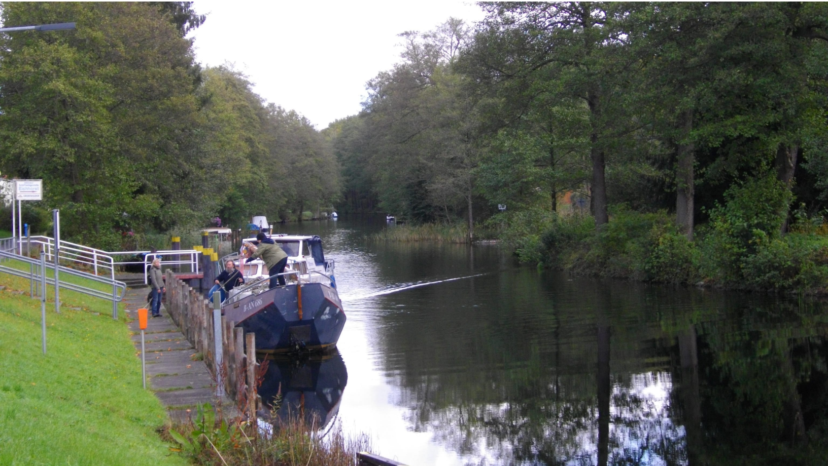
Bootsfahrt auf dem Finowkanal, Foto: Nadin Sauer