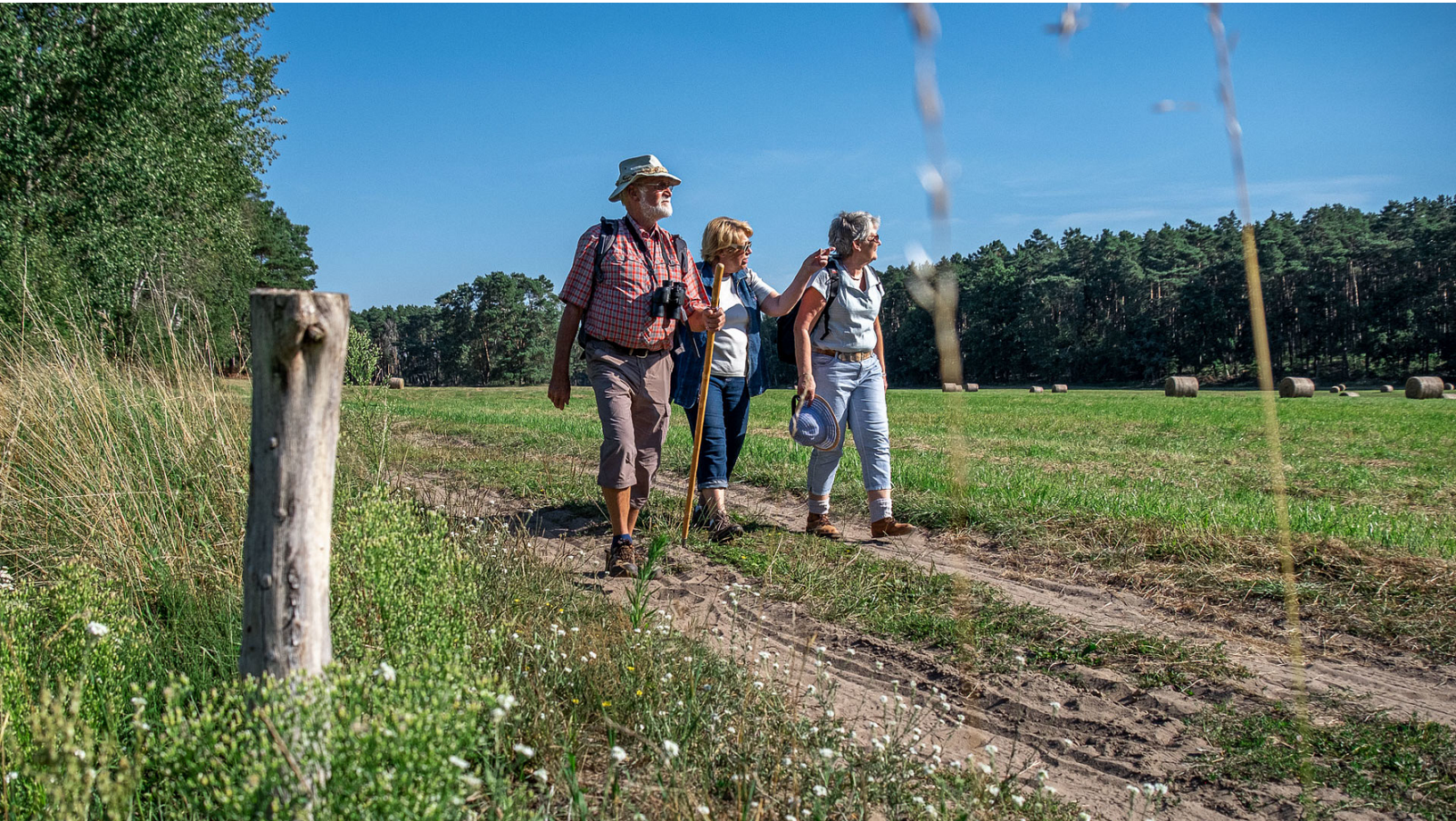
Sandweg nördlich der Naturparkstadt Biesenthal