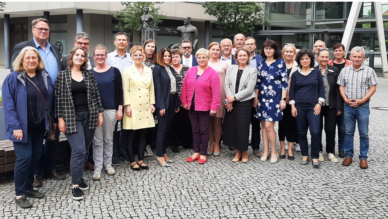
Teilnehmer der Fachkonferenz.