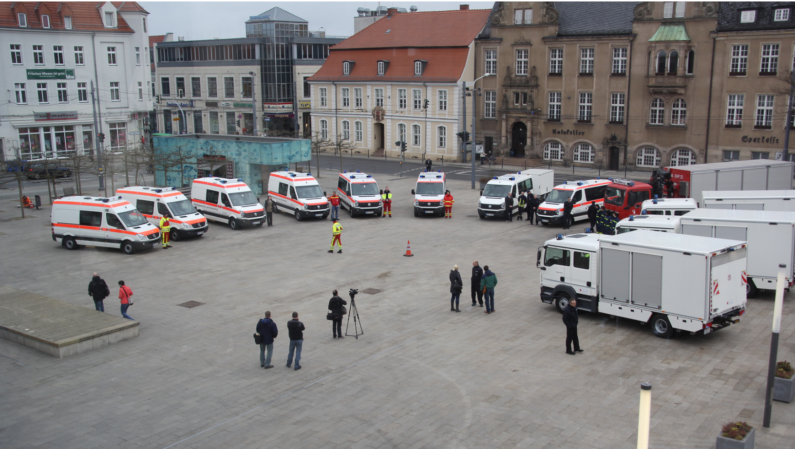
Kat-Schutz-Einheit auf dem Eberswalder Marktplatz