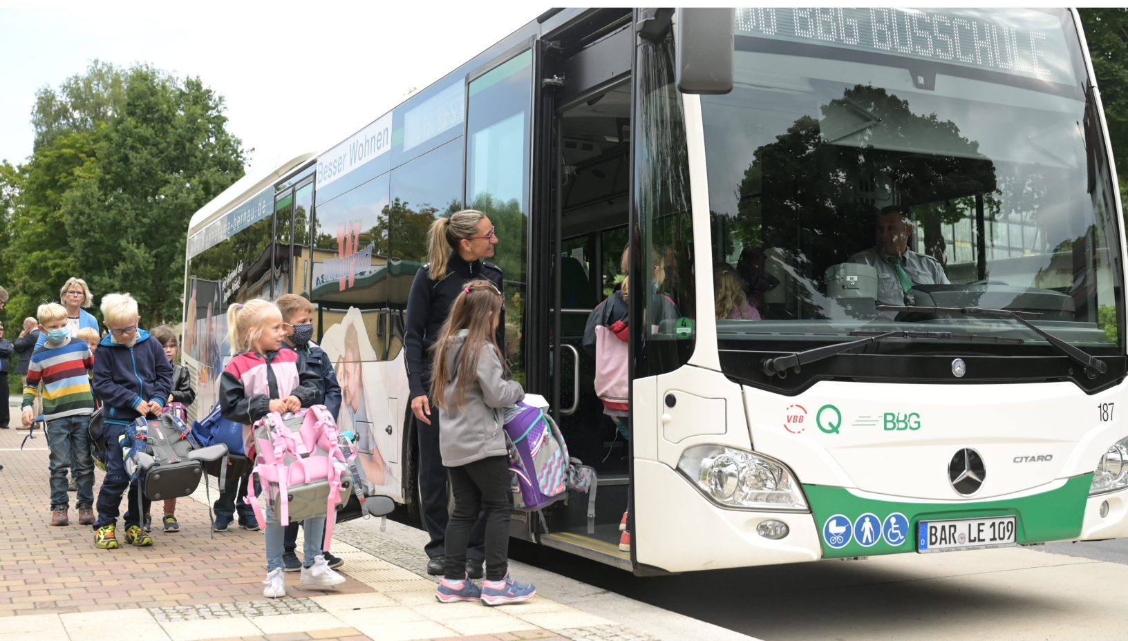
Auftakt zur Busschule im Jahr 2021 in Oderberg.