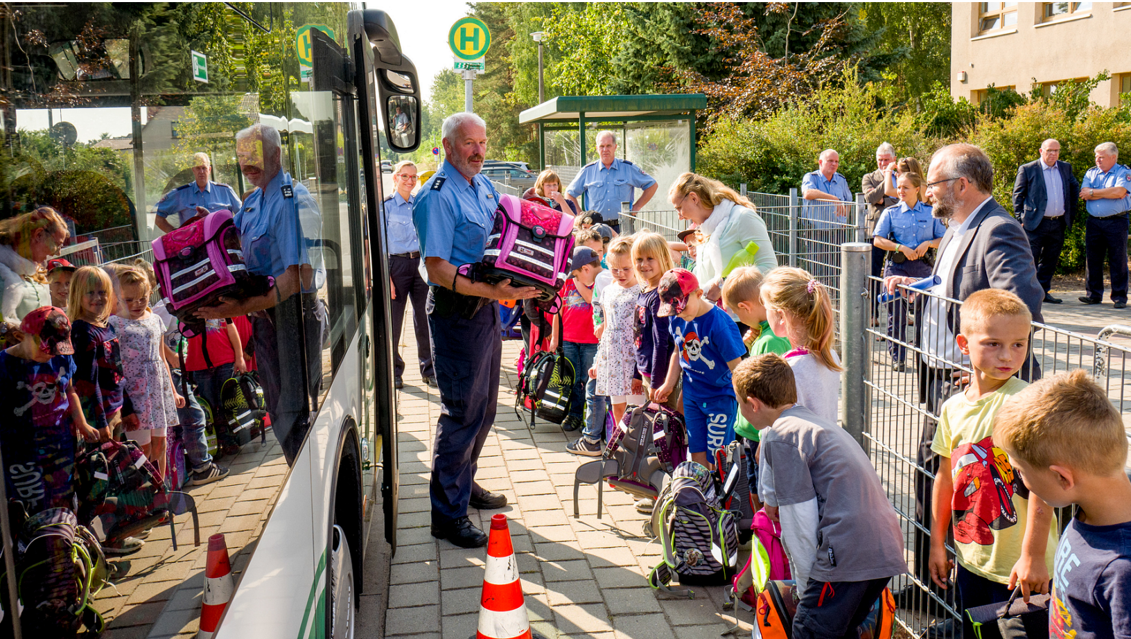
Foto aus 2019: Die Busschule vermittelt Erstklässlern im Landkreis Barnim auf meist unterhaltsame Weise, wie man richtig Bus fährt.