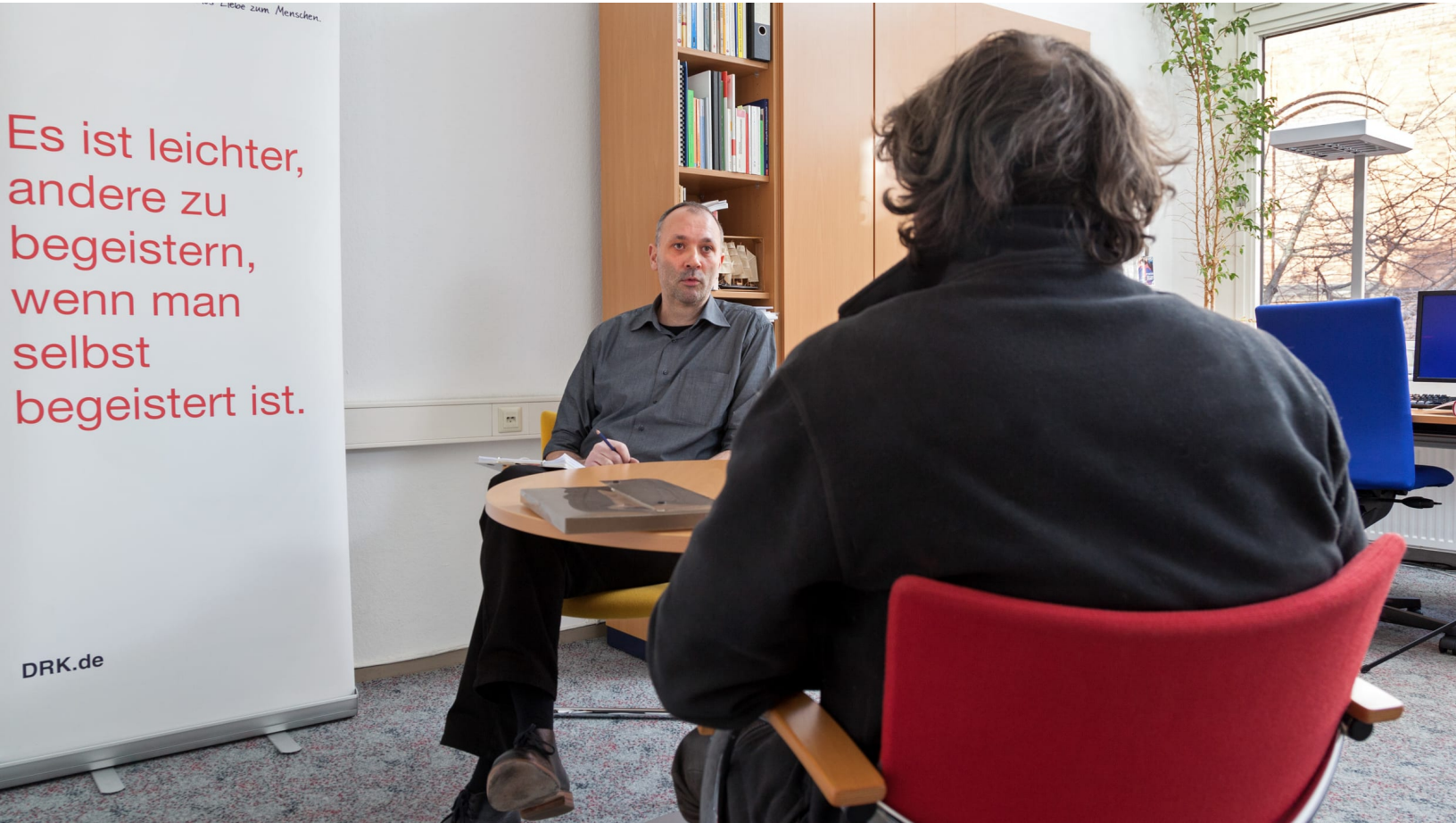
Schuldnerberatung beim DRK.